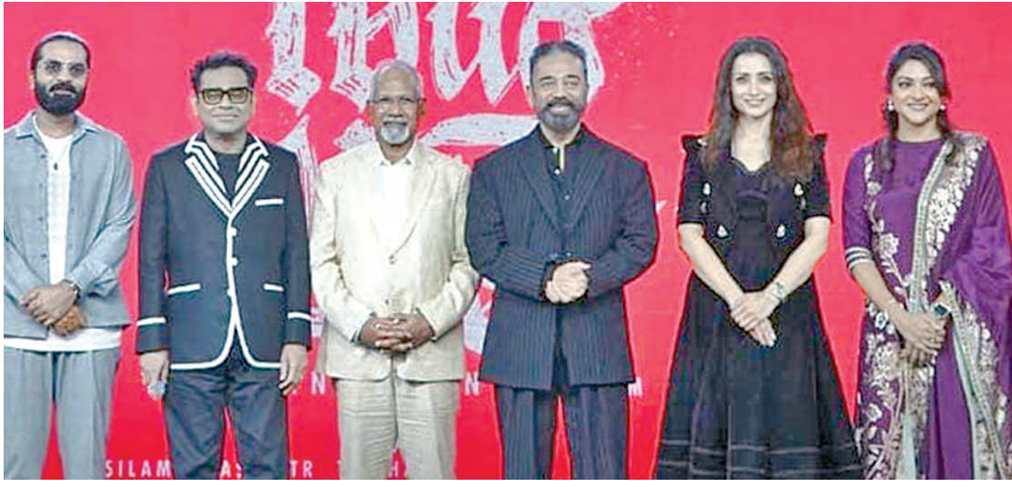
ఇందియన్ సినిమా రెజండర్స్ కమల్ హాసన్, మణిరత్నం పైలీ యాంటిసిపేటిడ్ గ్యాంగ్స్టర్ డ్రామా థగ్ లైఫ్ జూన్ 5న థియేటర్లలో విడుదలకు సిద్ధమవుతోంది. ఈ సందర్భంగా చిత్రబృందం ట్రైలర్ ను విడుదల చేసింది. ట్రైలర్ ఆరంభం నుంచే సమృద్ధిగా, ఈగ్ కూడ వరల్డ్ లోకి ఆడియన్స్ ని తీసుకెళ్తుంది. కమల్ హాసన్ వరల్డ్ ఫుల్ గ్యాంగ్స్టర్ పాత్రలో అదరగొట్టారు. శింబు, కమల్ బాండీర్ కథలో వెర్