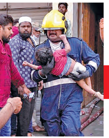
వార్మినార్ సమీపంలో ఆదివారం జరిగిన అగ్ని ప్రమాదంలో ఓ చిన్నారిని ఐదుగురు తీసుకువస్తున్న అగ్నిమాపక సిబ్బంది

విచారణకు సిఎం రేవంత్ ఆదేశం ప్రభాతవార్ ప్రధాన ప్రతినిధి, హైదరాబాద్, మే 18: గుల్షార్ హోటల్ జరిగిన భారీ అగ్ని ప్రమాదంపై ముఖ్యమంత్రి ఎ.రేవంత్ రెడ్డి విచారణకు ఆదేశించారు. ఈ >>2