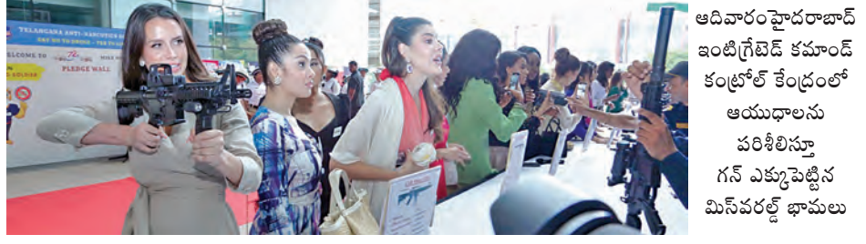
ఆదివారం హైదరాబాద్ ఇంటిగ్రేటెడ్ కమాండ్ కంట్రోల్ కేంద్రంలో ఆయుధాలను పరిశీలిస్తూ గన్ ఎక్స్ పెర్ట్లైన మిస్ వరల్డ్ ఛాంపియన్లు

'కమాండ్ కంట్రోల్'లో వరల్డ్ 'మిస్'లు హైదరాబాద్, మే 18. ప్రభాతవార్: రాష్ట్రంలో శాంతి భద్రతల పరిరక్షణ, మహిళలు పిల్లలపై వేధింపుల నివారణ, డ్రగ్స్ కట్టడికి చేపట్టిన చర్యలు, నేరాల నియంత్రణ, నేర నివారణలో ఉప యోగిస్తున్న ఆధునిక శాస్త్ర సాంకేతిక పద్ధతులు తదితర అంశాలపై తెలంగాణా పోలీస్ శాఖ చేపట్టిన పటిష్టమైన చర్యలపట్ల మిస్ వరల్డ్ కాంటెస్టెంట్ల సంకల్పిని వ్యక్తం చేశారు. డ్రగ్స్ నివారణపై తెలంగాణా పోలీస్ చేపట్టిన చర్యలకు తమ సంపూర్ణ మద్దతు తెలియ చేస్తూ పోస్టర్లపై సంతకాలు చేసి పలు మెసేజ్ లను కూడా రాసారు. 107 దేశాల మిస్ వరల్డ్ కాంటెస్టెంట్లు ఆదివారం బంజారా హిల్స్ లోని తెలంగాణా ఇంటిగ్రేటెడ్ కమాండ్ కంట్రోల్ సెంటర్ ను సందర్శించి, రాష్ట్రంలో శాంతి భద్రతల రక్షణకు ప్రభుత్వం ఆమలు >>2